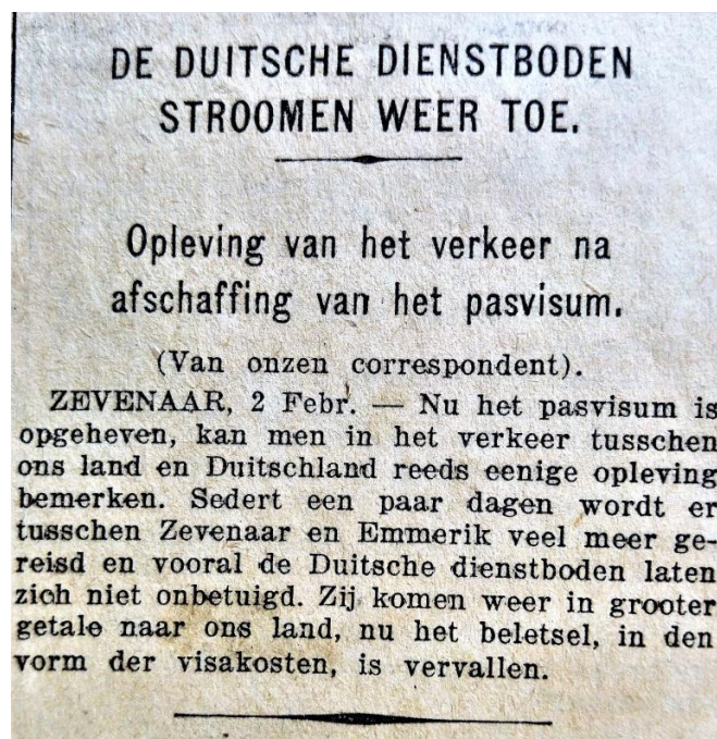
Uit: Het Nieuws van den Dag 3 februari 1926

Ook dit 'probleem' is van alle tijden. En hiervoor hoeven we niet eens zover van huis te gaan of terug in de tijd. In de jaren na de Tweede wereldoorlog dacht één op de drie Nederlanders aan emigratie. Eén op de twintig Nederlanders emigreerde ook daadwerkelijk. Ruim 550.000 mensen vertrokken naar Canada, Amerika, Australië en Nieuw Zeeland omdat het daar zo leeg en rijk leek en hier zo vol en arm! In het 'topjaar' 1952 vertrokken er bijna 50.000 Nederlanders naar deze landen! Ik heb alleen het gevoel dat het toen nog niet als een probleem werd gezien.